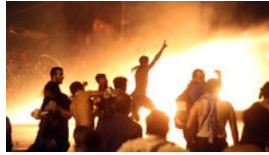
La crise des ordures à Beyrouth, au Liban (http://fr.canoe.ca/infos/galleries_photos/2015/08/21/15082105825.html)