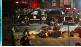
Une bombe explose à Bangkok (http://fr.canoe.ca/infos/galleries_photos/2015/08/21/15082105825.html)

Toutes les photos (/infos/galleries_photos/)