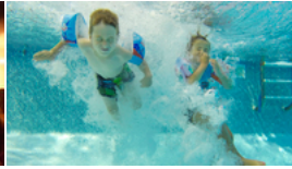
Les meilleures photos de la semaine du 15 au 21 août 2015