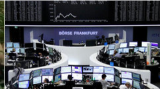
La déroute des Bourses asiatiques gagne Wall Street (/argent/actualites/archives/2015/08/20150824083501.html)