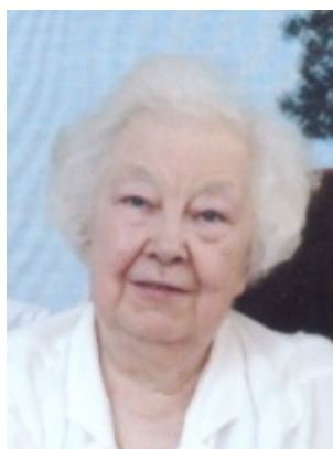
Fiche créée le : 2010-02-20